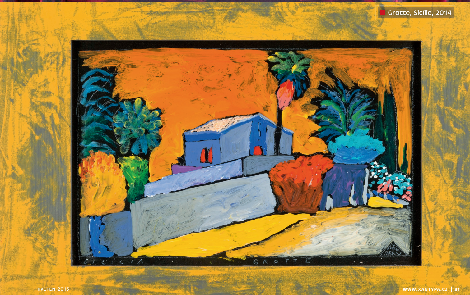
■ Grotte, Sicille, 2014