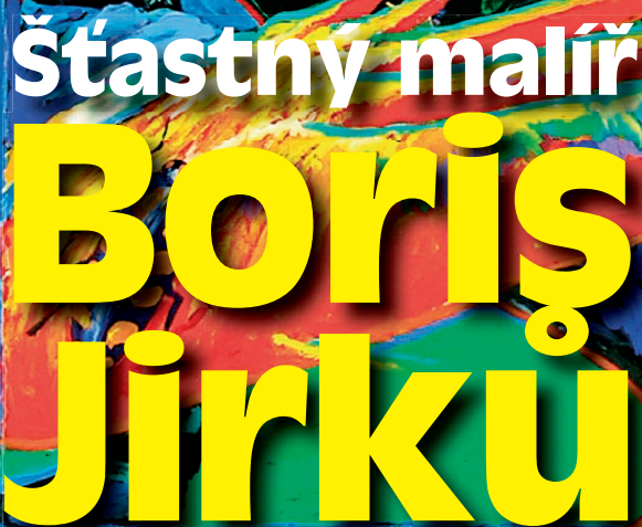
■ Autoportrét šťastného malíře, 2013