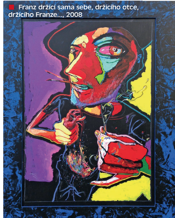
■ Franz držící sama sebe, držícího otce, držícího Franze..., 2008

text Magdalena Šebestová