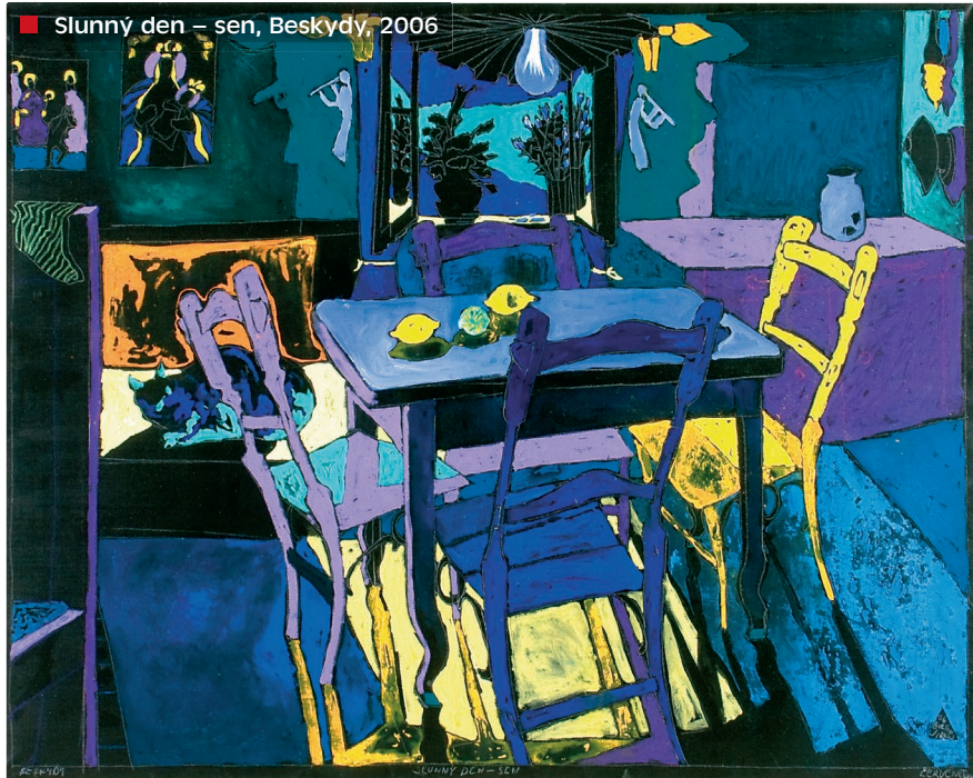
■ Slunný den – sen, Beskydy, 2006